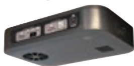
キャンピングカー専用 オゾン発生器「C-Air」